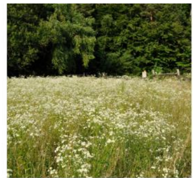
Auf Jahre hinaus viel Arbeit

Viele gebietsfremde Arten kommen in ihrer neuen Umwelt nicht zurecht. Einige gebietsfremde Arten treffen jedoch auf günstige Bedingungen und etablieren sich in der Natur und vermehren sich. Diese Arten werden als Neobiota bezeichnet. Handelt es sich um Pflanzen, spricht man von Neophyten , bei Tieren von Neozoen und bei Pilzen von Neomyceten . Viele dieser Arten fügen sich unauffällig in ihrer Umgebung ein und vermehren sich so stark, dass sie Schäden verursachen und unsere einheimische Flora und Fauna bedrängen. Eine der grossen Herausforderungen ist das eindämmen und eliminieren vom Berufkraut.