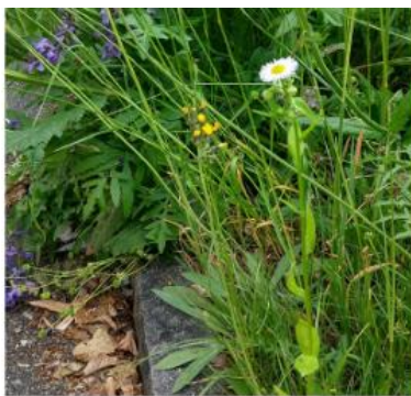
Harmloser Anfang - schnell übersehen!

Das Einjährige Berufkraut schadet der Biodiversität und fordert alle heraus.